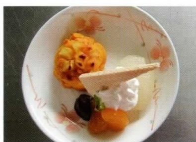
おやつの種類も豊富