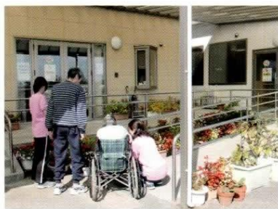
お出かけでリフレッシュ。