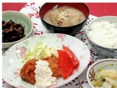
出来立ての食事を提供します。